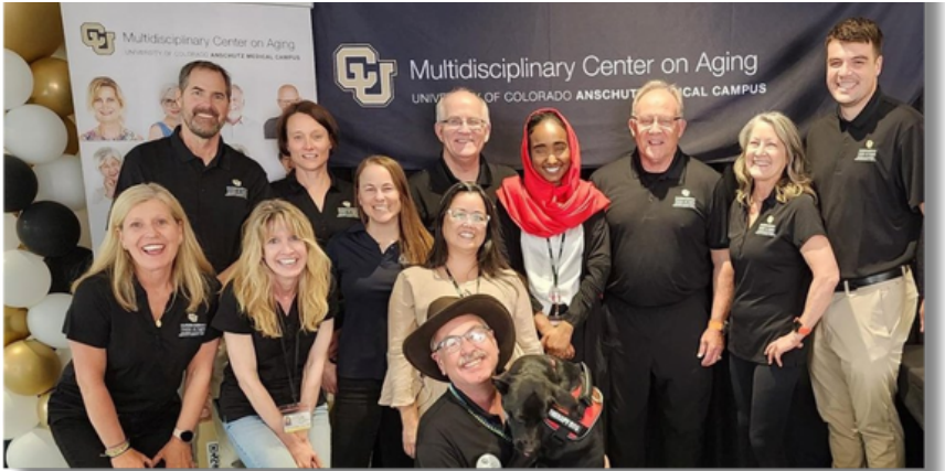
Equipo que participó en el Research Roadshow.

Los Roadshows de investigación incluyen diferentes actividades que ofrecen oportunidades para probar nuevos recursos centrados en la salud y proporcionar comentarios a los equipos de investigación. Un ejemplo es SteadiPlay, una innovación desarrollada por un fisioterapeuta convertido en ingeniero. El dispositivo hace que el entrenamiento del equilibrio para la prevención de caídas sea divertida a medida que los participantes cambian su peso en una tabla de equilibrio para dirigir un automóvil alrededor de una carrera de obstáculos. A través de actividades de prueba con usuarios como estas, los adultos mayores tienen la experiencia directa de cómo su voz y participación contribuyen a mejorar los productos de la investigación y marcan la diferencia en las vidas de los adultos mayores.